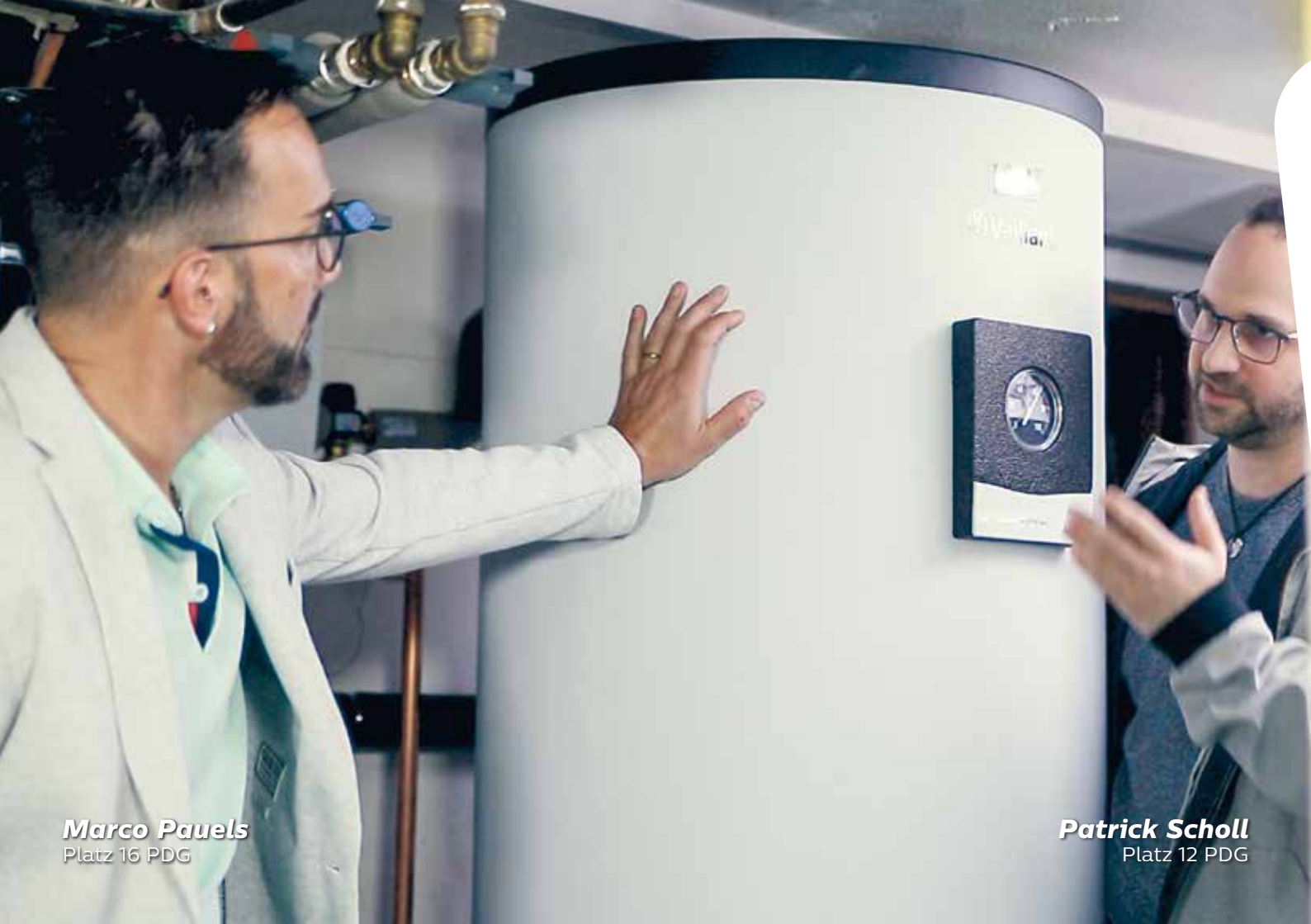
Marco Pauels Platz 16 PDG