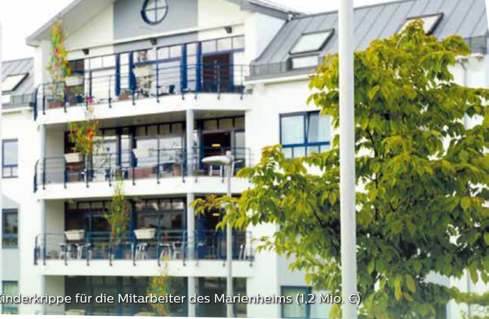
Neubau einer Kinderkrippe für die Mitarbeiter des Marienheims (1,2 Mio. €)